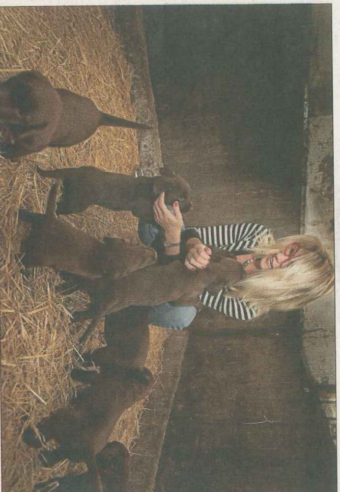
Lunas og Larsens otte hvalpe er nu store nok til at flytte hjem til deres nye menneske-familier.

Så det bliver hårdt at skulle af med de dejlige hvalpe, fordi man knytter